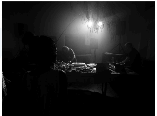
PØNG @ forplay society, Kochi, Indien