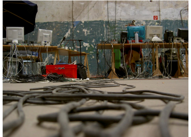
INSTALLATION - Festspielhaus Hellerau Dresden

Jede Installation wird für den jeweiligen Ort entwickelt und auf seine Besonderheiten abgestimmt.