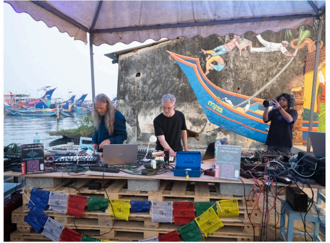
PØNG @ Armaan Collective, Kochi, Indien

Ob Festival, Club, Galerie, Kirche oder Naturraum - wir passen uns dem Ort an und nutzen ihn kreativ.