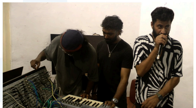
WORKSHOP @ forplay society, Kochi, Indien