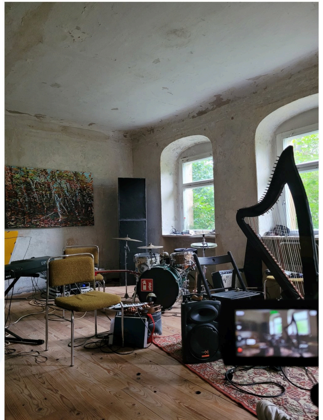
WORKSHOP @ Musiksommer Bärenstein

Spielerische und kreative Formate ermöglichen Teilhabe unabhängig von Alter oder Vorerfahrung.