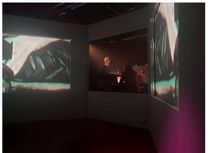
PØNG @ Chemiefabrik, Dresden